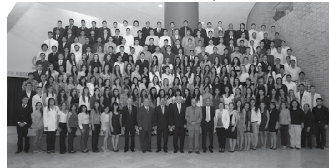
El Rector de la UANL, Jesús Ancer Rodríguez; el Presidente de la Fundación UANL, Raúl Rangel Hinojosa, acompañados por autoridades de la Máxima Casa de Estudios, con los jóvenes del Programa de Movilidad. 27 de junio de 2013.

El Sorteo de la Siembra Cultural sigue dando frutos... En esta edición 2013, el Programa de Movilidad Nacional e Internacional da muestras de su consolidación al apoyar a 900 alumnos con deseos de vivir una experiencia académica en otro país, gracias a los recursos económicos que la Fundación UANL provee a esta Institución.