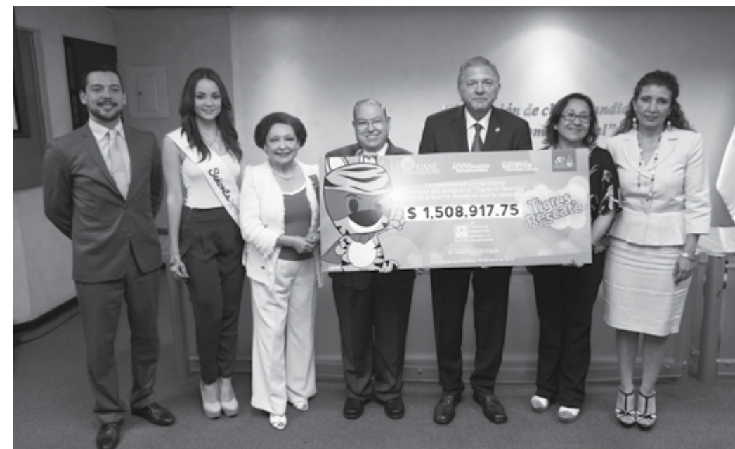
El Rector de la UANL, Jesús Ancer Rodríguez; el Presidente del Patronato de Centros de Integración Juvenil A.C., Gregorio Treviño Lozano, y demás personalidades. 19 de junio de 2013.

La Universidad Autónoma de Nuevo León concluyó con éxito el Programa Tigres al Rescate en su edición 2012-2013 e hizo oficial la entrega de un donativo a Centros de Integración Juvenil A.C. por un millón 500 mil pesos, recaudado a través de diversas actividades.