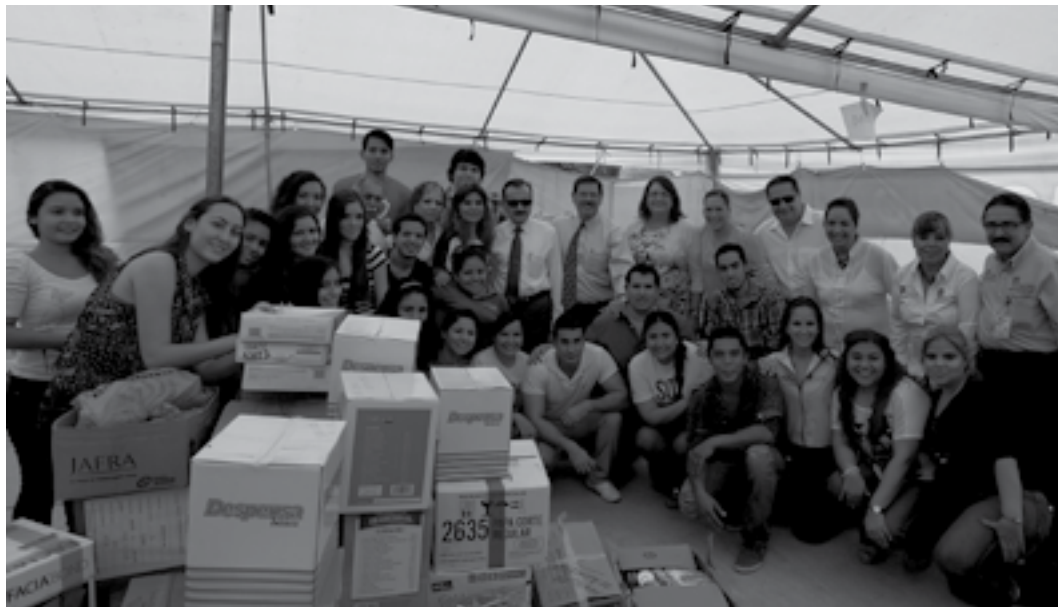
El Secretario General de la UANL, Rogelio Garza Rivera, acompañado de autoridades, trabajadores y estudiantes. 30 de septiembre de 2013.

Una vez más quedó demostrada la solidaridad de la comunidad universitaria. La campaña Tigres al Rescate por Nuevo León logró coleccionar 73 mil 308 kilos de ayuda para las comunidades del Estado más afectadas por el fenómeno natural "Ingrid".