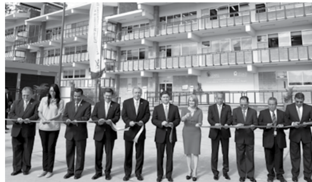
El Rector de la UANL, Jesús Ancer Rodríguez; el Gobernador del Estado de Nuevo León, Rodrigo Medina de la Cruz, acompañados de personalidades del Estado y de la Máxima Casa de Estudios en el corte de listón. 19 de septiembre de 2013.

Al Macro Centro Comunitario Bicentenario, ubicado en la Colonia Independencia, se suma un plantel de la Escuela Industrial y Preparatoria Técnica "Álvaro Obregón" (EIAO) para fortalecer la estrategia del Gobierno estatal dirigida a transformar esa zona y contribuir a bajar los índices de inseguridad.