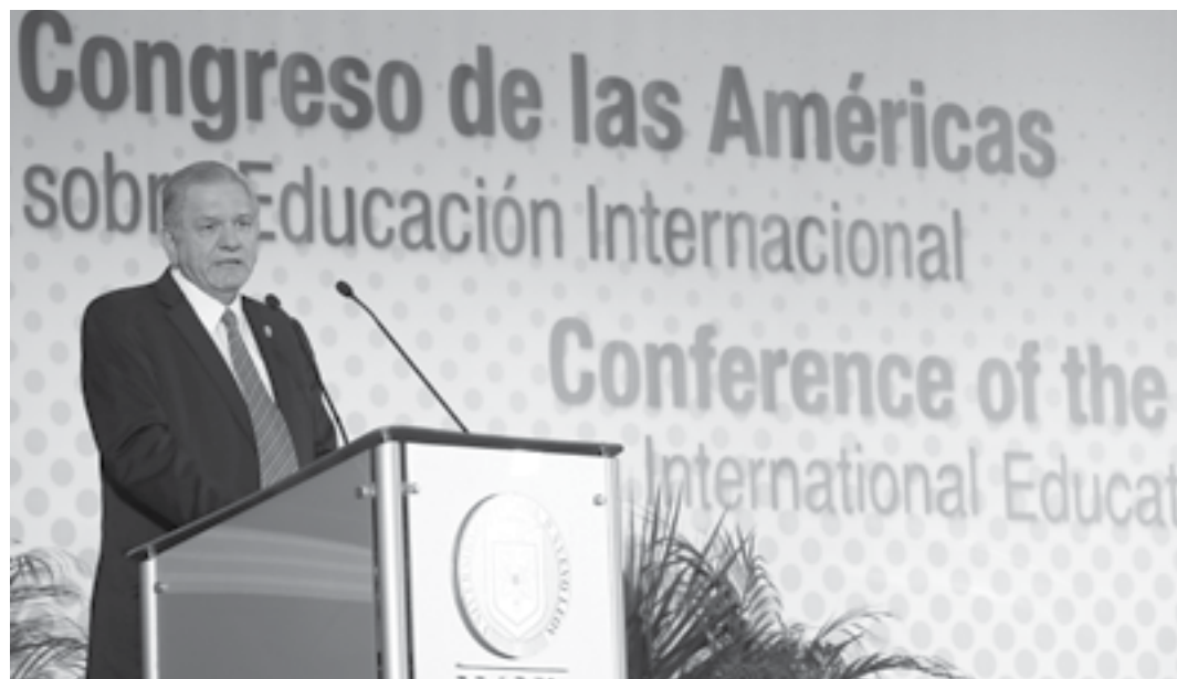
El Rector de la UANL, Jesús Ancer Rodríguez, dando el discurso de clausura del CAEI 2013. 18 de octubre de 2013.

Con el propósito de crear un espacio común interamericano que diera la oportunidad de conocer y dialogar sobre desafíos y paradigmas futuros de la educación superior, concluyó el Congreso de las Américas sobre Educación Internacional CAEI, 2013.