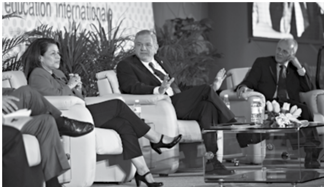
El Rector de la UANL, Jesús Ancer Rodríguez, en su participación en la Entrevista plenaria: el rol de la internacionalización y otros temas vitales en educación superior. 17 de octubre de 2013.

En educación superior la internacionalización es más que sólo movilidad estudiantil, debe ser un elemento integrador en una región como América que tiene desafíos trascendentales como es la masificación de la educación, la calidad, la utilización de las nuevas tecnologías de la información y el reto aún mayor de construir ciudadanía.