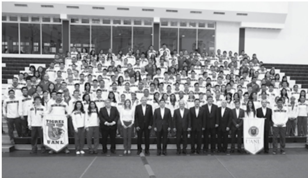
El Rector de la UANL, Jesús Ancer Rodríguez; el Gobernador del Estado de Nuevo León, Rodrigo Medina de la Cruz; acompañados de autoridades universitarias, gubernamentales y deportistas. 16 de mayo de 2013.

La campaña “Salvando vidas”, dirigida a la población adolescente del estado, inició actividades desde la Escuela y Preparatoria Técnica Médica de la UANL, hasta donde acudió el Gobernador Rodrigo Medina de la Cruz para encabezar la ceremonia y compartir los avances del Plan de Acción en respuesta de la Encuesta Estatal de Salud y Nutrición.