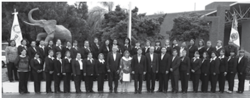
El Rector de la UANL, Jesús Ancer Rodríguez, y el Gobernador del Estado de Nuevo León, Rodrigo Medina de la Cruz, acompañados por autoridades universitarias, de Gobierno y personal de enfermería. 13 de mayo de 2013.