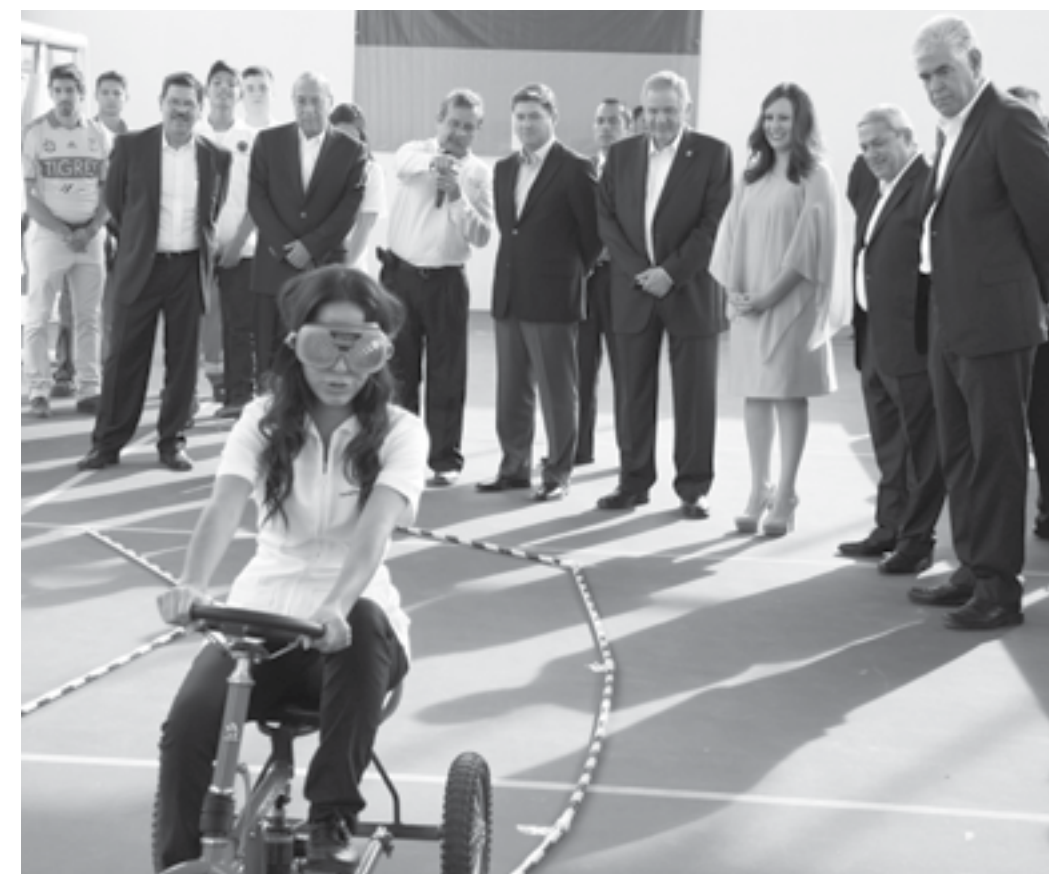
Autoridades de la UANL y del Gobierno del Estado, encabezadas por el Rector Jesús Ancer Rodríguez y el Gobernador Rodrigo Medina de la Cruz, observando una dinámica de una alumna de la Escuela y Preparatoria Técnica Médica. 23 de abril de 2013.

La campaña “Salvando vidas”, dirigida a la población adolescente del Estado, inició actividades desde la Escuela y Preparatoria Técnica Médica de la UANL, hasta donde acudió el Gobernador Rodrigo Medina de la Cruz para encabezar la ceremonia y compartir los avances del Plan de Acción en respuesta de la Encuesta Estatal de Salud y Nutrición.