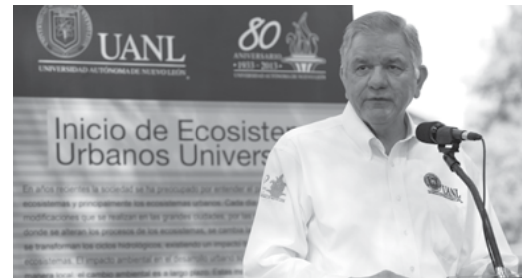
El Rector de la UANL, Jesús Ancer Rodríguez, inauguró el primer Ecosistema Urbano Universitario. 22 de abril de 2013.

En el Día Mundial de la Tierra, que se celebra el 22 de abril, la UANL inauguró su primer Ecosistema Urbano Universitario, espacio donde coexisten la flora y la fauna nativas con el ser humano y se conjugan el medio ambiente, las áreas metropolitanas y la calidad de vida de los habitantes.