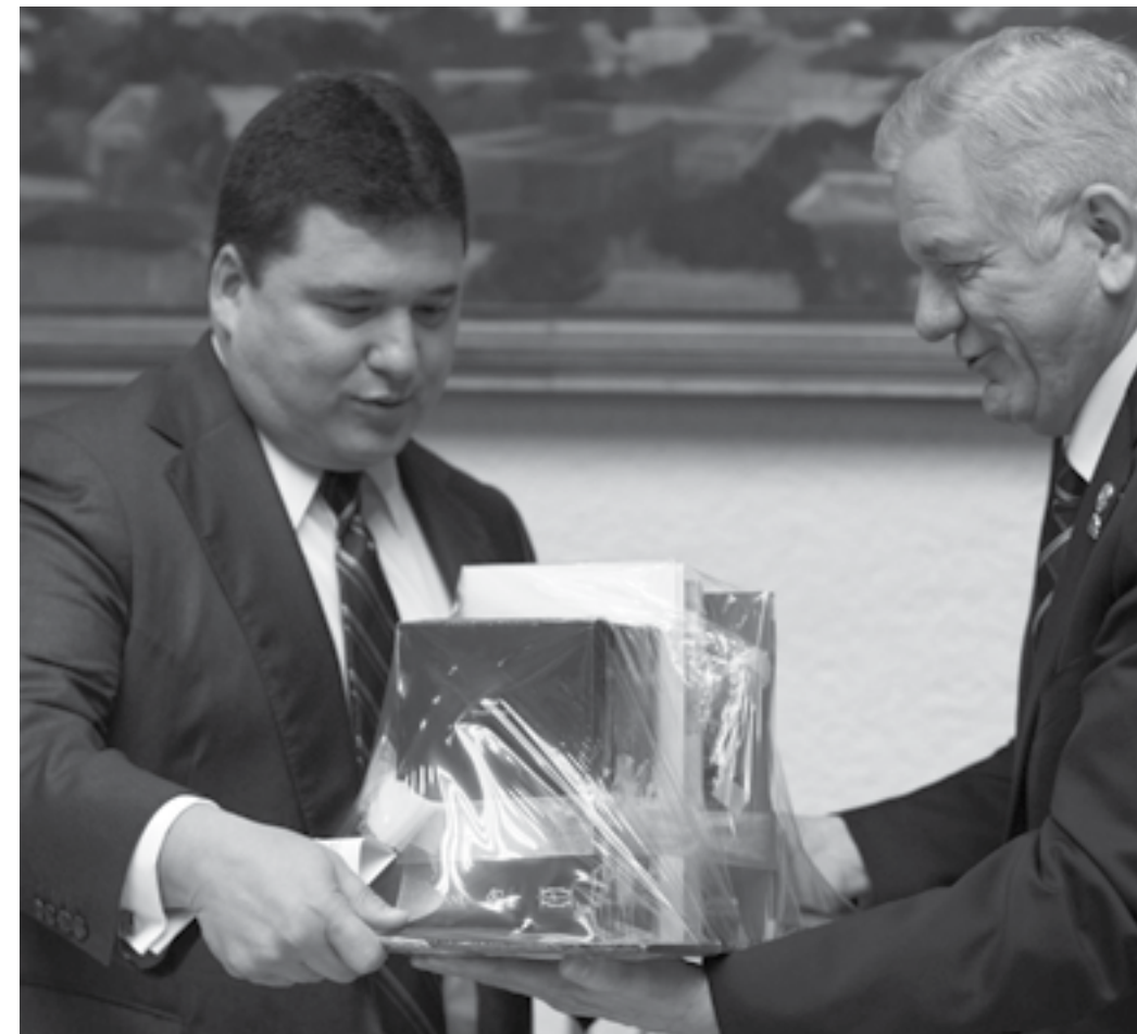
El Rector de la UANL, Jesús Ancer Rodríguez, haciendo entrega de un paquete de libros al Alcalde de San Pedro, Ugo Ruiz Cortés. 23 de abril de 2013.

La Capilla Alfonsina, con la traducción al español de “Dios” (Dieu) de Víctor Hugo, echó la casa por la ventana para una celebración múltiple: el 80 aniversario de la Universidad Autónoma de Nuevo León, la vida y obra de don Alfonso Reyes y la faceta de traductor del poeta Tomás Segovia.