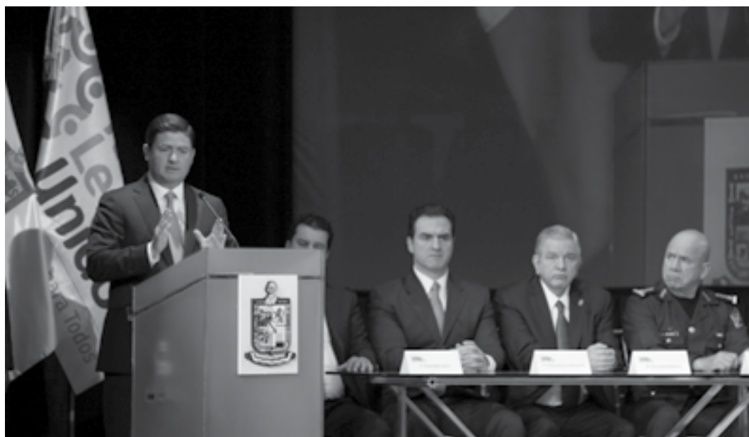
El Rector de la UANL, Jesús Ancer Rodríguez, el Gobernador del Estado de Nuevo León, Rodrigo Medina de la Cruz y demás personalidades. 27 de enero de 2014.

El Aula Magna del Centro Cultural Universitario Colegio Civil es sede del primer Congreso de Proximidad y Prevención del Delito convocado por el municipio de General Escobedo, programado del 27 al 30 de enero.