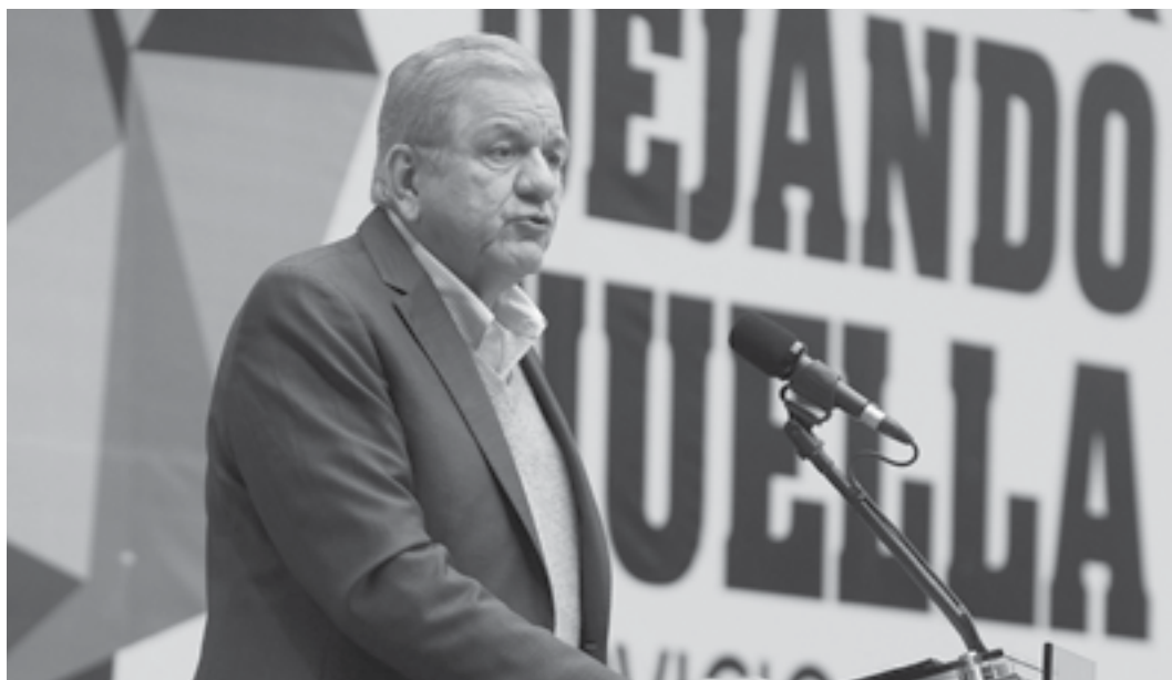
El Rector de la UANL, Jesús Ancer Rodríguez, brindando un mensaje a los estudiantes que participaran en esta cruzada. 25 de enero de 2014.

Ser los embajadores sociales del cambio, es la labor que tendrán que realizar los 8 mil 303 estudiantes de la UANL que realizarán su servicio social y comunitario durante el primer semestre del año, llamado que se hizo durante el taller "Dejando Huella 2014".