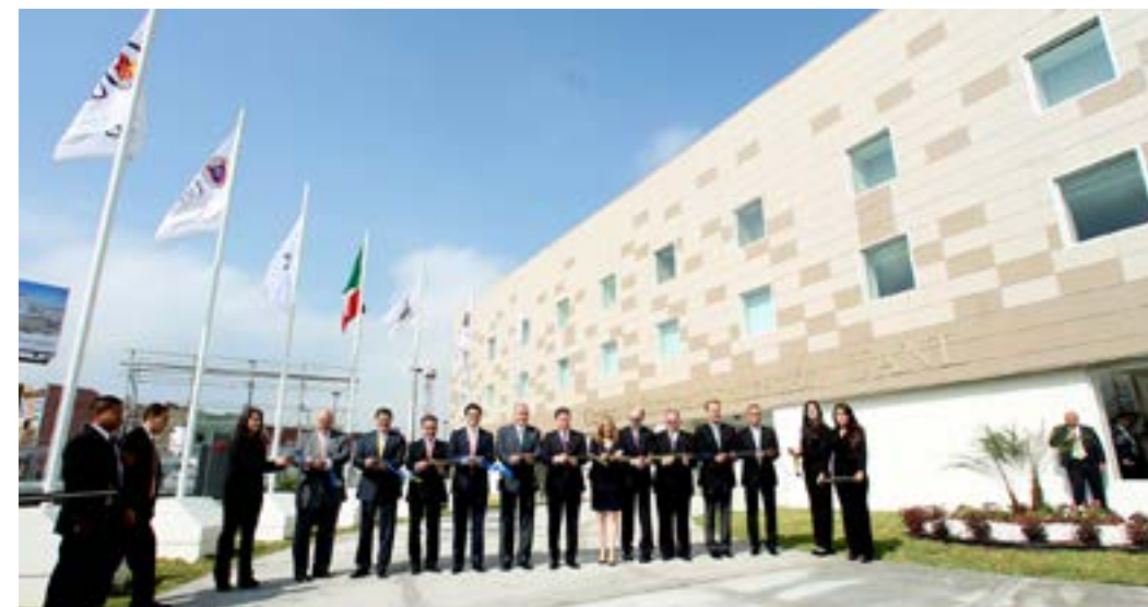
El Rector de la UANL, Jesús Ancer Rodríguez; el Gobernador del Estado de Nuevo León, Rodrigo Medina de la Cruz, acompañados de distinguidas personalidades. 19 de mayo de 2014.

Los indicadores académicos, investigación y vinculación de carácter internacional que hoy registra la Universidad Autónoma de Nuevo León son envidiables: 169 convenios con universidades extranjeras, 8 programas binacionales de doble titulación, más de 650 materias impartidas en un segundo idioma, un promedio de mil 100 estudiantes al año en movilidad académica en 28 países y 17 programas con acreditación internacional.