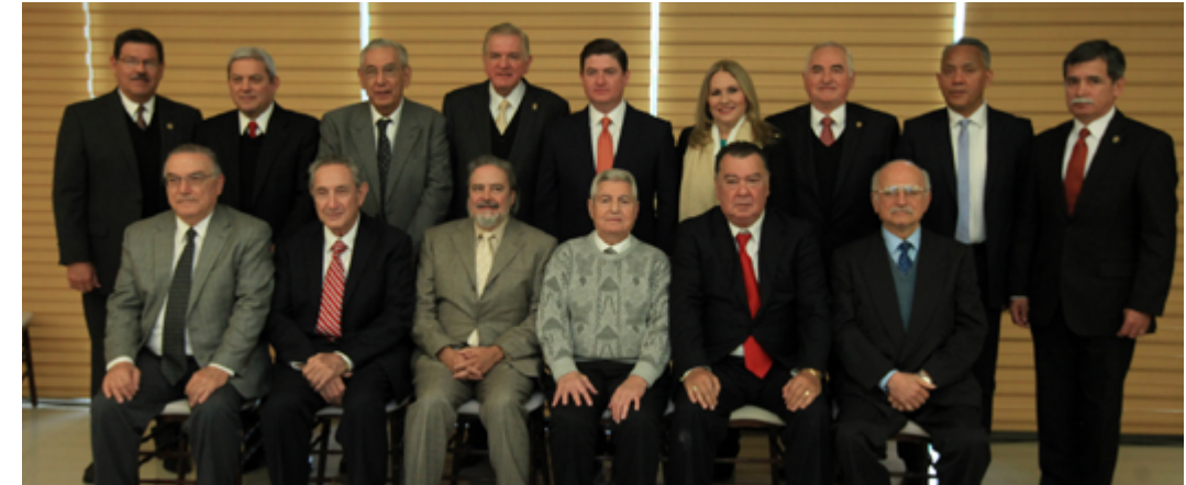
El Rector de la UANL, Jesús Ancer Rodríguez; el Gobernador del Estado de Nuevo León, Rodrigo Medina de la Cruz, acompañados de distinguidas personalidades. 8 de enero de 2015.