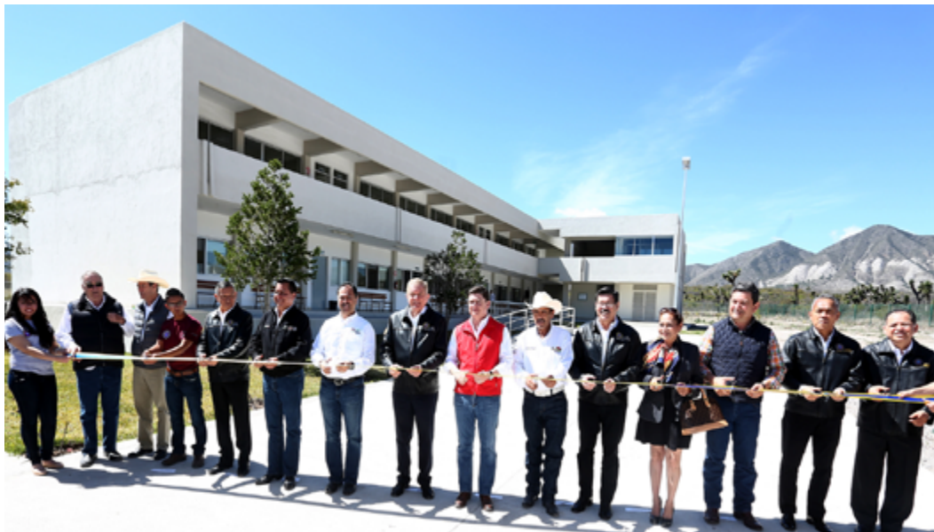
El Rector de la UANL, Jesús Ancer Rodríguez; y el Gobernador del Estado de Nuevo León, Rodrigo Medina de la Cruz, inauguran las nuevas instalaciones acompañados de autoridades municipales y universitarias. 26 de febrero de 2015.

G aleana, N. L.- Una inversión de 7.3 millones de pesos realizó la Preparatoria No. 4 para la construcción y equipamiento de cinco nuevas aulas, espacios que permitirán ampliar la cobertura educativa de bachillerato en la región sur del estado.