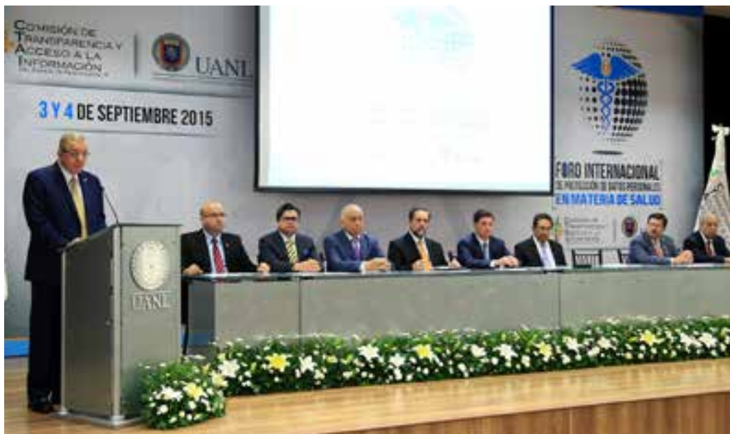
La Universidad Autónoma de Nuevo León, la Comisión de Transparencia y Acceso a la Información (CTAINL), la Suprema Corte de Justicia de la Nación (SCJN) y la Secretaría de Salud convocaron a participar en el V Foro Internacional de Protección de Datos Personales en Materia de Salud los días 3 y 4 de septiembre.

L a Universidad Autónoma de Nuevo León, la Comisión de Transparencia y Acceso a la Información (CTAINL), la Suprema Corte de Justicia de la Nación (SCJN) y la Secretaría de Salud convocaron a participar en el V Foro Internacional de Protección de Datos Personales en Materia de Salud los días 3 y 4 de septiembre.