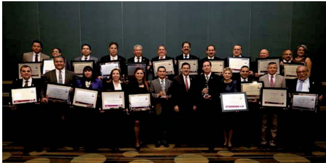
El Rector de la UANL, Rogelio Garza Rivera, acompañado por los directores de las dependencias que recibieron el Reconocimiento a la Competitividad 2015. 25 de noviembre de 2015.

La Universidad Autónoma de Nuevo León figuró durante la vigésima sexta entrega del Premio Nuevo León a la Competitividad (PNLC), ceremonia en la que se galardonó a 22 escuelas de bachillerato y a la Dirección General de Informática (DGI).