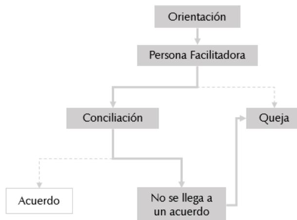
Diagrama 3. Si después de llevar la Conciliación no se llega a un acuerdo, se podrá interponer una Queja según lo establecido en el artículo 32.

Artículo 47. Cuando se derive la posible comisión de uno o varios delitos, la Universidad hará la denuncia a las autoridades penales competentes, sin perjuicio de la aplicación de las sanciones establecidas en la legislación vigente.