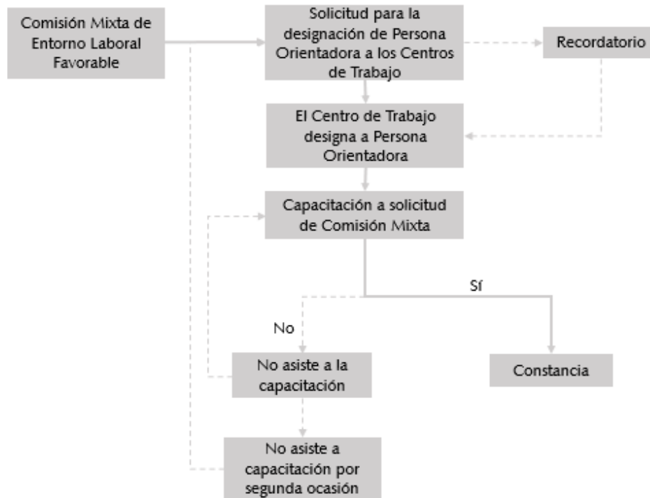
Diagrama 1. Procedimiento para la Selección de Personas Orientadoras

Artículo 20. La Comisión Mixta tendrá la obligación de verificar anualmente que los Centros de Trabajo cuenten con la Persona Orientadora designada.